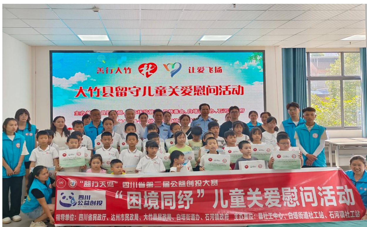
▲第二期公益创投项目实施过程