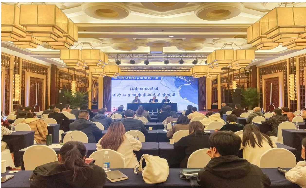
▲聚焦医疗卫生健康行业社会组织开展培训