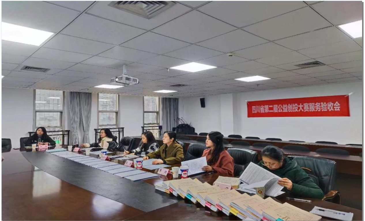
▲第二届公益创投执行方工作验收