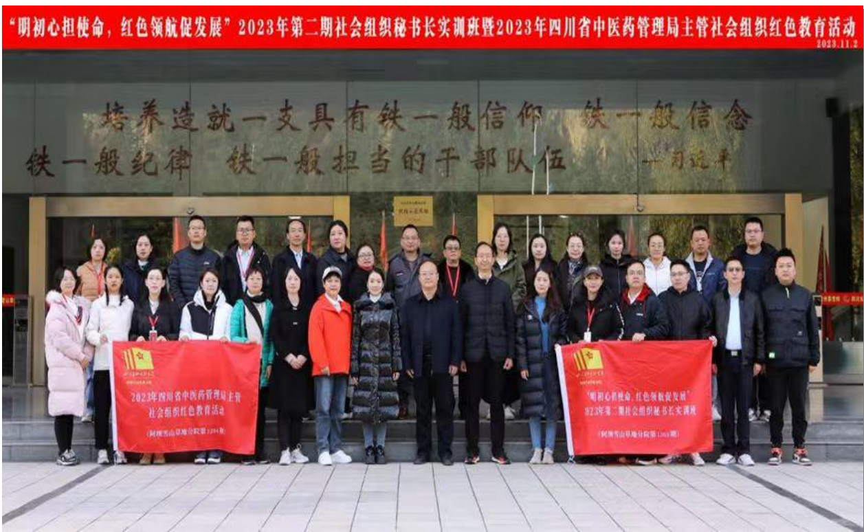
▲第二期秘书长实训班红色教育活动