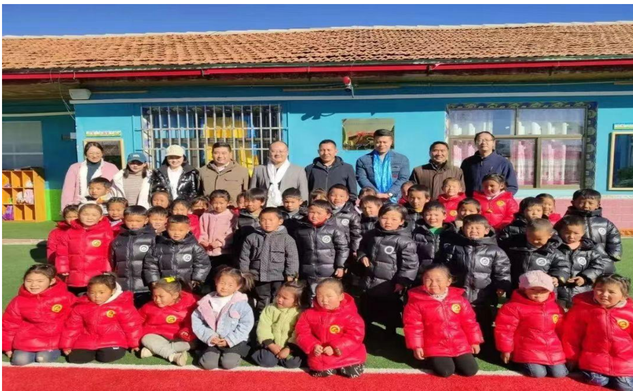
▲第二期公益创投阿坝州红原项目督导