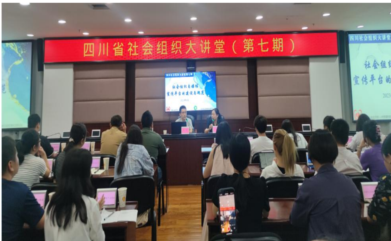
▲第七期四川省社会组织大讲堂