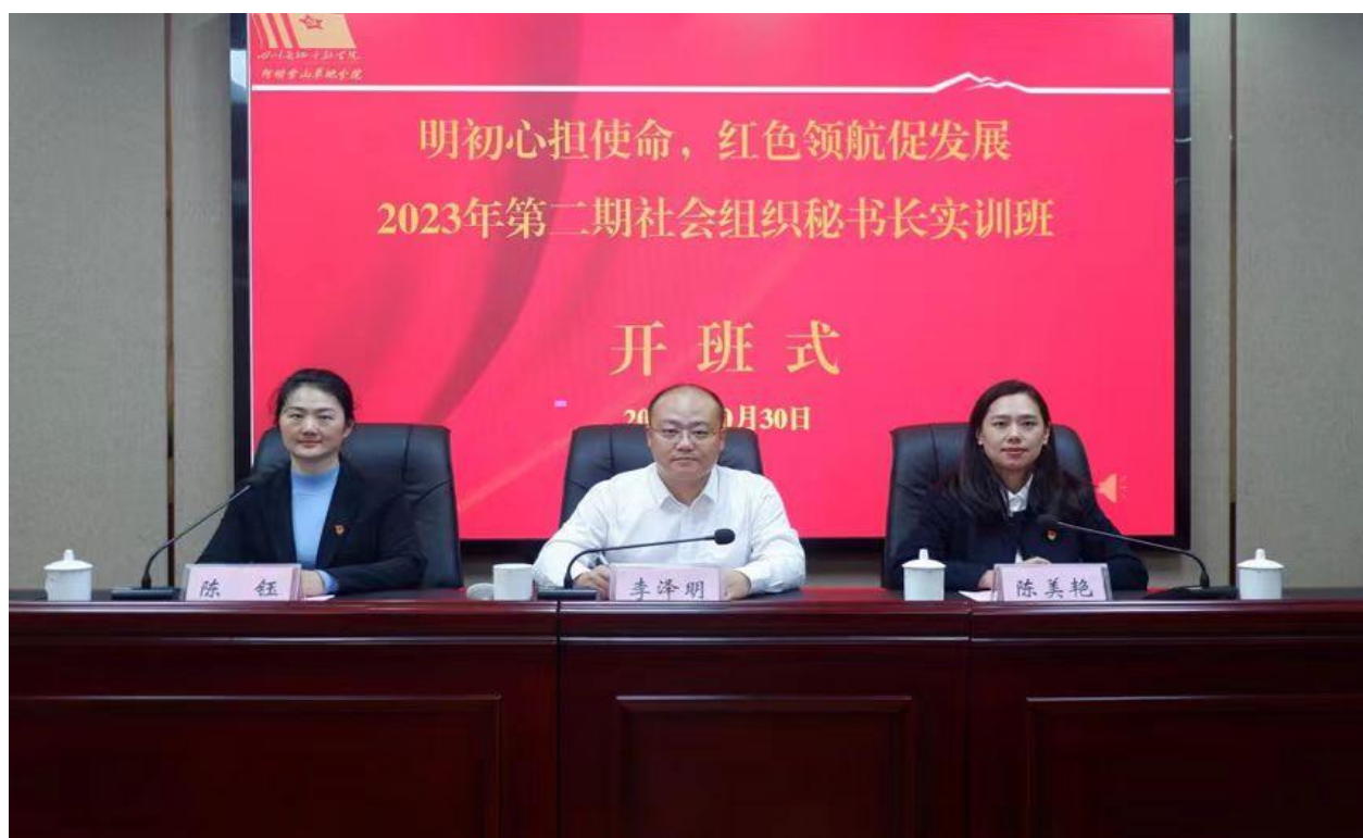
▲第二期社会组织秘书长实训班党建外训开班仪式