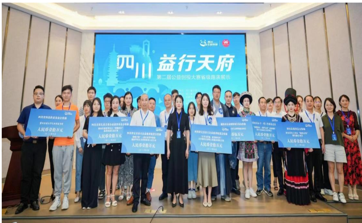
▲第二届公益创投大赛路演