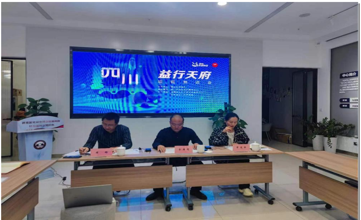
▲第二届公益创投大赛项目推进会