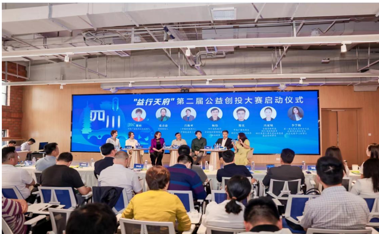
▲第二届公益创投大赛启动仪式