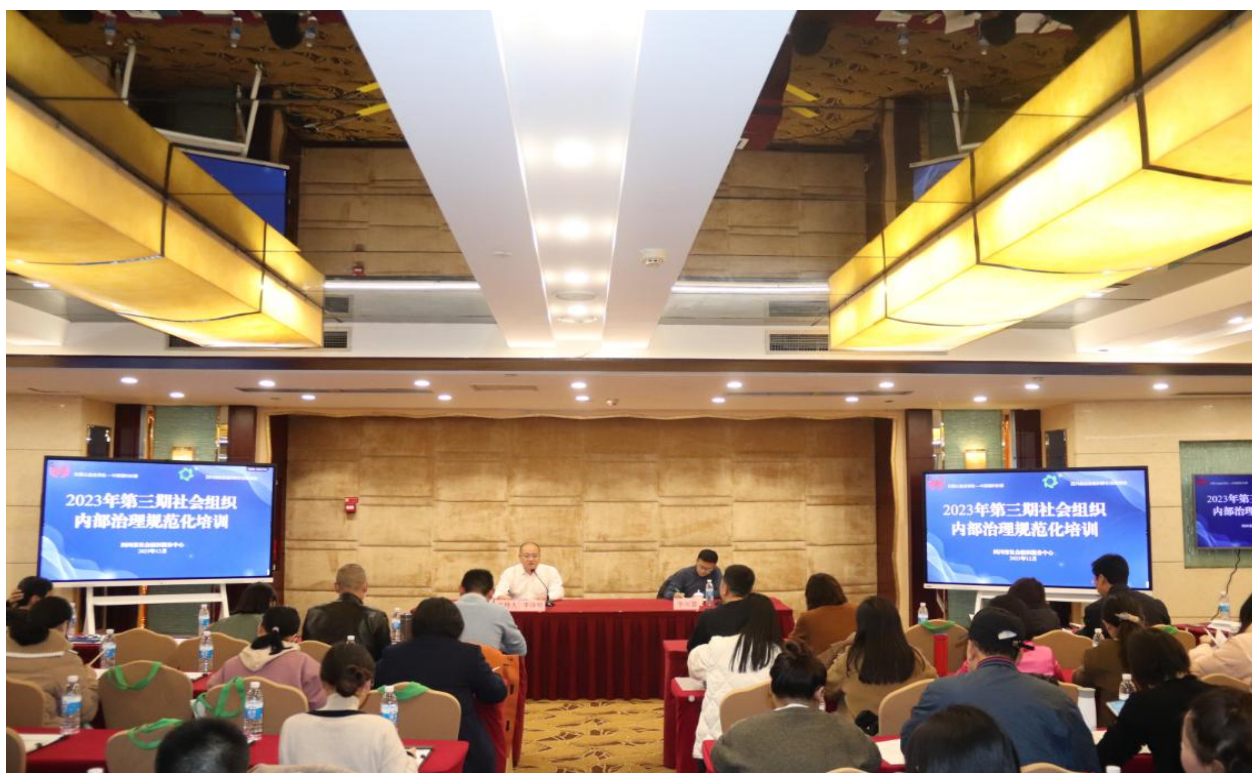
▲第三期社会组织内部治理规范化培训