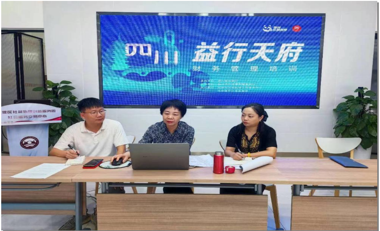
▲第二届公益创投大赛线上财务管理培训