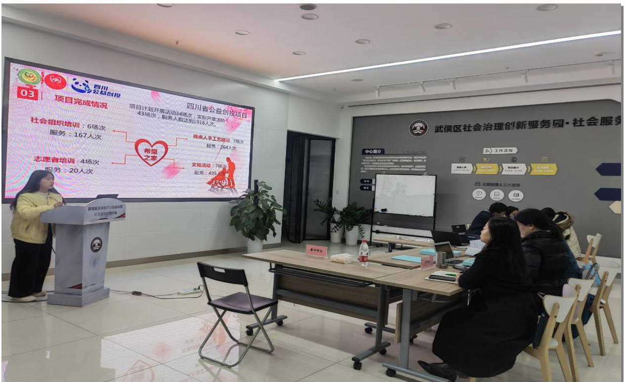
▲第二届公益创投资助项目绩效评价