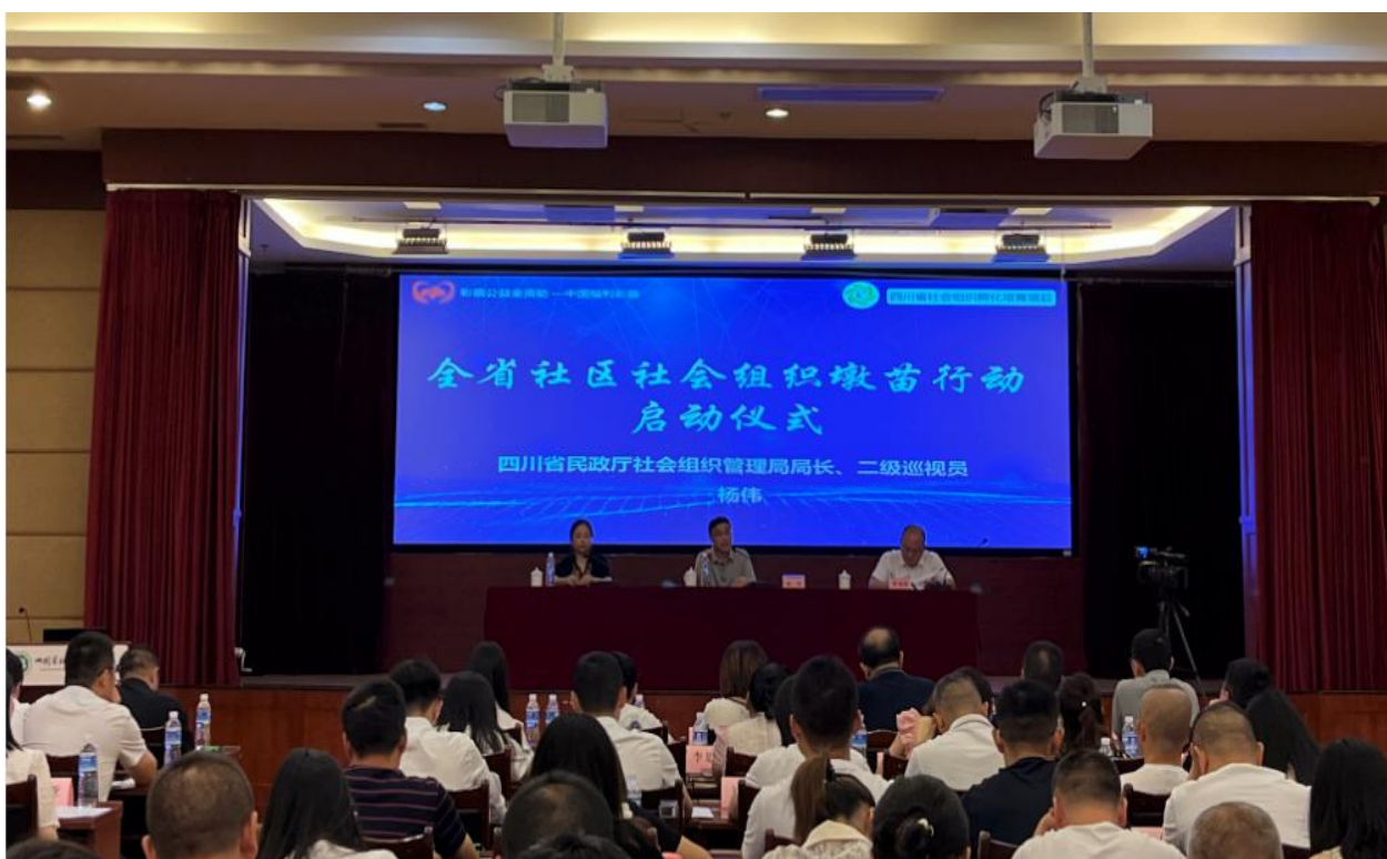
▲全省社区社会组织墩苗行动